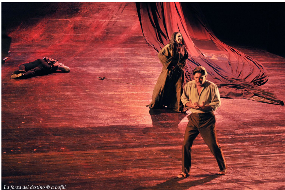
La forza del destino © a bofill

Unser Abendessen genießen wir gemeinsam in einem sehr schönen Restaurant an der Küste.