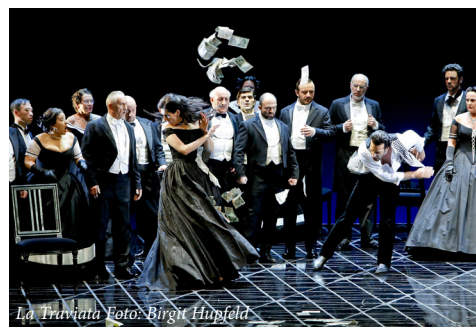
La Traviata

Heute Abend können Sie sich selbst davon überzeugen - Der große Opernklassiker über eine Liebe gegen die Zeit und alle Konventionen.