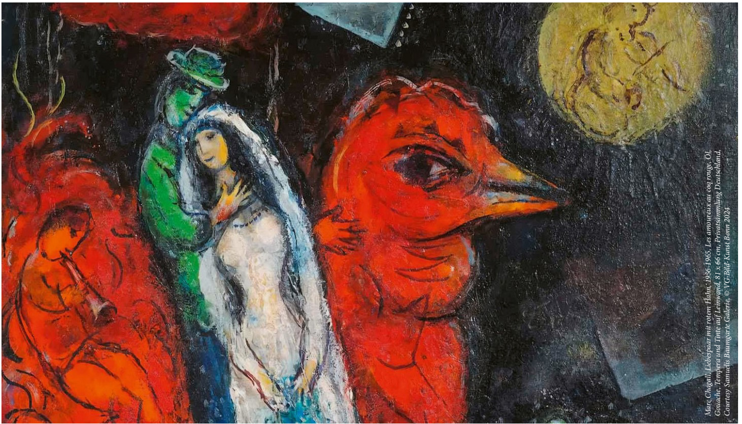
Marc Chagall, Liebespaar mit rotem Hahn, 1956-1965, Les amoureux au coq rouge, Öl, Gouache, Tempera und Thite auf Leinwand, 81 x 66 cm, Privatsammlung Deutschland, Courtesy Samuëls Baumgarte Galerie