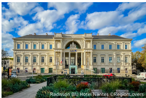
Radisson Blu Hotel Nantes

Nach einem entspannten Frühstück starten wir zu einer Schiffahrt auf der Loire nach Saint-Nazaire . Gemächlich gleitet das Schiff über den breiten Strom, während wir die Uferlandschaften betrachten: historische Hafenanlagen, moderne Industrieanlagen und das Zusammenspiel von Fluss und Natur. Die Loire, Lebensader der Region, erzählt Geschichten von Handel, Schiffbau und kulturellem Austausch. Ein kurzer Aufenthalt in Saint-Nazaire eröffnet zudem weite Ausblicke auf den Atlantik und die maritime Bedeutung dieser Region, in der Fluss und Meer aufeinandertreffen. Anschließend führt uns eine Panoramafahrt entlang der Côte d'Amour , einer abwechslungsreichen Küstenlandschaft mit weiten Stränden, kleinen Buchten und Salzwiesen. Ziel ist die mittelalterliche Stadt Guérande , die bis heute vollständig von einer mächtigen Stadtmauer umschlossen ist. Bei einem Rundgang durch die historische Altstadt erleben wir das geschlossene Stadtbild mit engen Gassen, steinernen Bürgerhäusern und der imposanten Stiftskirche. Danach besuchen wir die Salzgärten von Guérande , wo seit Jahrhunderten nach traditionellen Methoden Meersalz gewonnen wird. Wir erfahren Wissenswertes über die Arbeit der Paludiers und das berühmte Fleur de Sel, das weit über die Region hinaus geschätzt wird. Am frühen Abend Rückkehr nach Nantes.