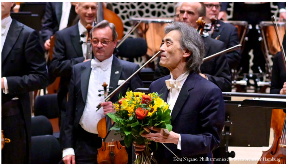
Kent Nagano, Philharmonisches Staatsorchester Hamburg

Wie klingt fließende Musik? Das 2. Philharmonische Konzert widmet sich der Musikästhetik des Fin-de-siècle. Trotz des konkreten Titels „La Mer“ komponiert Debussy in diesem beliebten Orchesterstück keine genaue musikalische Abbildung des Meeres, sondern schildert eine abstrakte, in Tönen gefasste Impression von Wasserbewegungen, Wellen, Ebbe und Flut. Bekannt ist Debussy auch für seine Vertonung von Maurice Maeterlincks „Pelléas et Mélisande“, doch auch Gabriel Fauré hatte bereits vier Jahre zuvor seine Version der Geschichte des tragischen Liebespaars der griechischen Mythologie in Töne gefasst. In New York schrieb Rachmaninow 1909 das Soundtrack-ähnlichste seiner Klavierkonzerte: sein drittes, das wie kaum ein anderes für den Kompositionsstil des russischen Virtuosen steht. Mit Evgeny Kissin steht der ideale Interpret dieser Musik auf der Bühne.