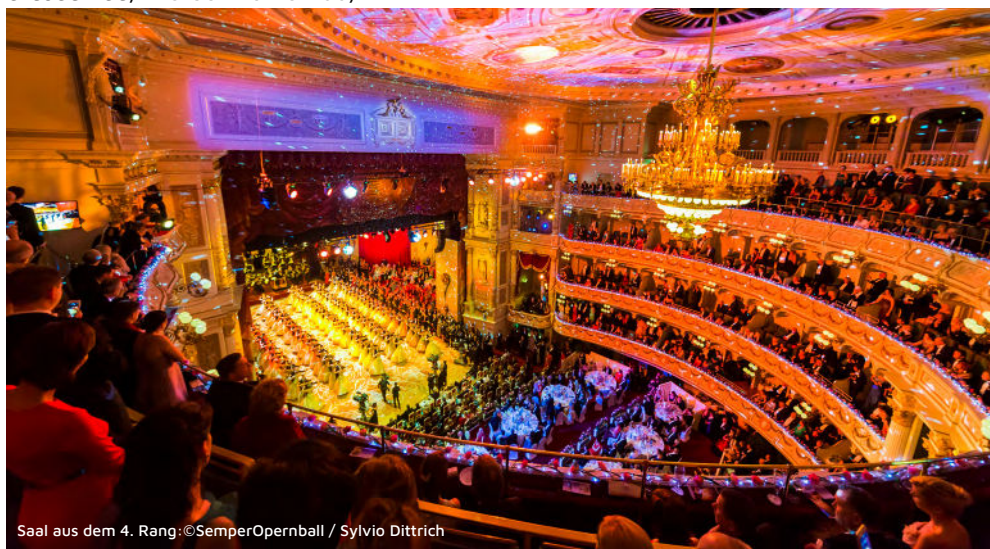
Saal aus dem 4. Rang: ©SemperOpernball / Sylvio Dittrich

Nach dem Frühstück bleibt etwas Zeit, bevor wir den Heimweg antreten. Transfer zum Flughafen Dubai und um 15.25 Uhr Flug nach Frankfurt. Ankunft in Frankfurt gegen 19.30 Uhr. Weiterreise mit der Bahn.