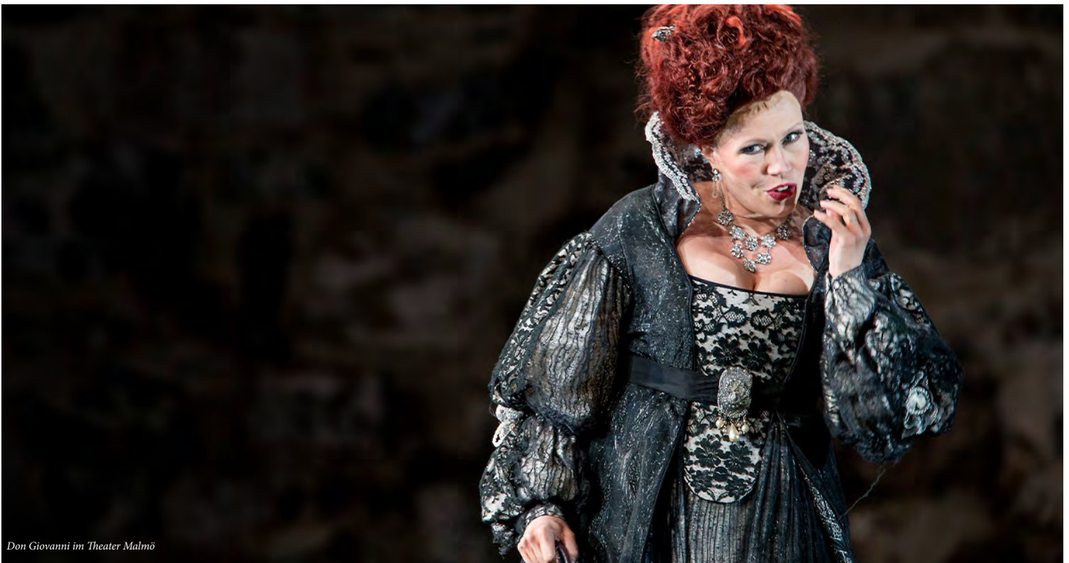
Don Giovanni im Theater Malmö

Nach Ankunft in Malmö unternehmen wir einen Spaziergang auf der Promenade von Västra Hamnen. Västra Hamnen ist ein hochmoderner Stadtteil auf ehemaligem Hafen- und Industriegelände. Der Stadtteil ist vergleichbar mit den Docklands in London oder ähnlichen Stadtteilen in Helsingborg, Göteborg und Stockholm. Nach einem gemeinsamen Abendessen besuchen wir das Malmö Theater und erleben Mozarts Don Giovanni. Anschliessend fahren wir zurück nach Kopenhagen.