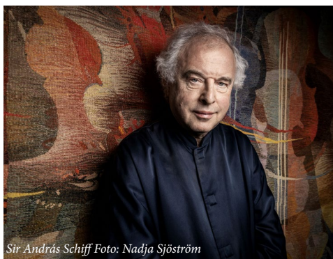
Sir András Schiff

Nach dem Frühstück möchten wir heute die zweitgrößte Stadt Österreichs bei einer Stadtführung erkunden. Wunderschön und stimmungsvoll die Gassen in der Altstadt, das Glockenspiel am gleichnamigen Platz, das Mausoleum und der Dom, die Grazer Burg und die Doppelwendeltreppe, der Hauptplatz mit dem Grazer Rathaus und anderen Prachtbauten. Zum Mittagessen kehren wir in ein typisches Restaurant ein. Am Nachmittag sind wir auf dem Schlossberg und werden die schönste und weiteste Aussicht auf die Stadt Graz genießen sowie im Graz Museum Schlossberg alles über die bewegte Geschichte des Schlossberges erfahren. Nach dem Besuch fahren wir zum Hotel zurück. Der restliche Tag steht Ihnen zur freien Verfügung.