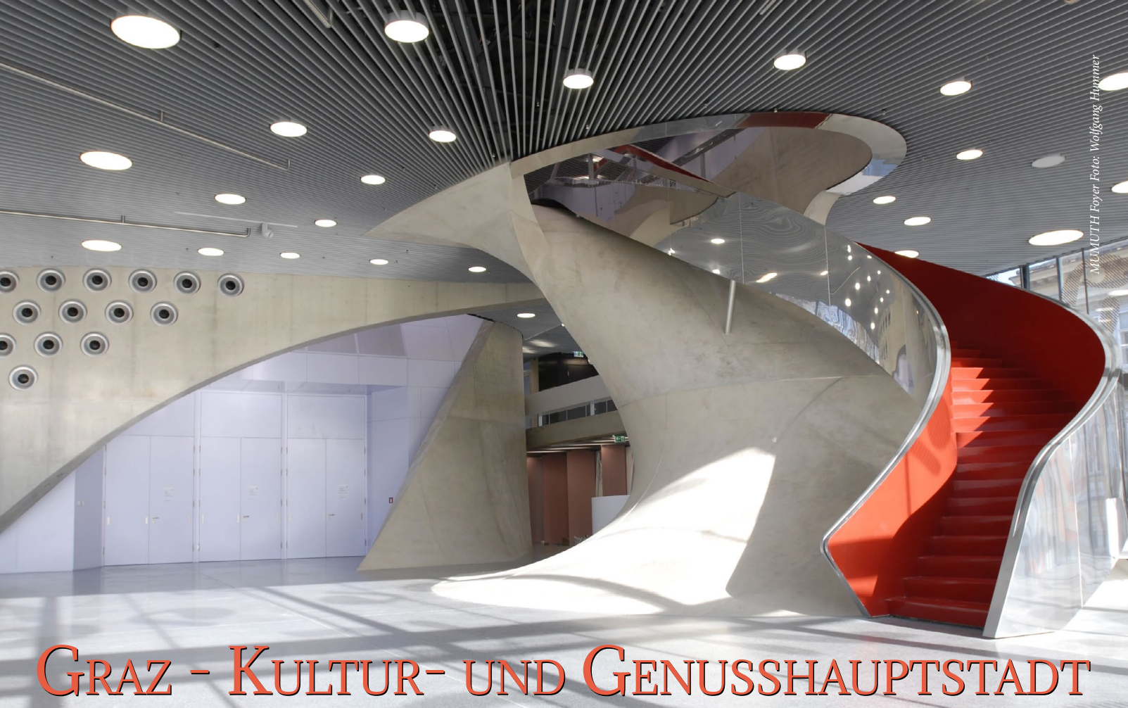
MANUETH Foyer